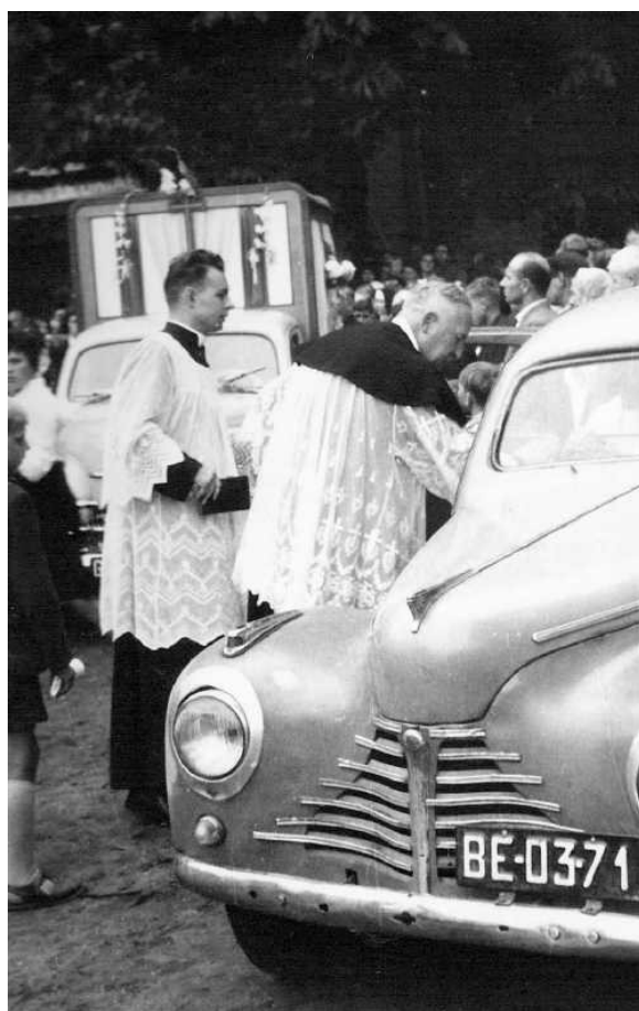
Pożegnanie Obrazu ks. Proboszcz i ks. Misiorny