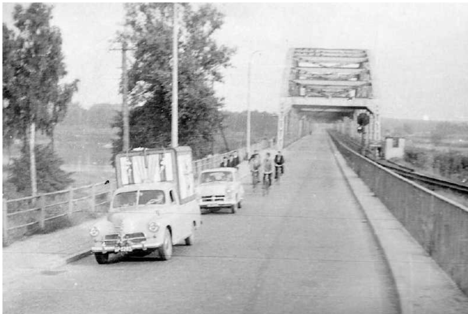
Obraz na moście fordońskim

W 1960 roku, jesienią, w parafii był wędrujący Obraz Matki Bożej Częstochowskiej.