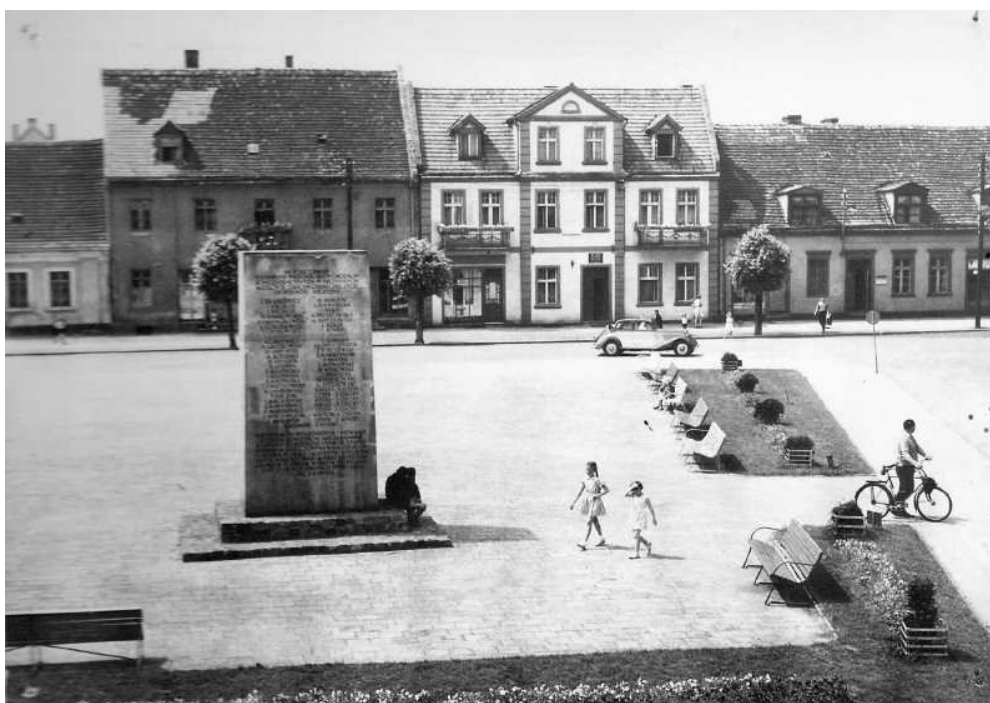
Plac Zwycięstwa – dawny Rynek, z pomnikiem ku czci pomordowanych mieszkańców Fordonu i okolicy. 1959 r.