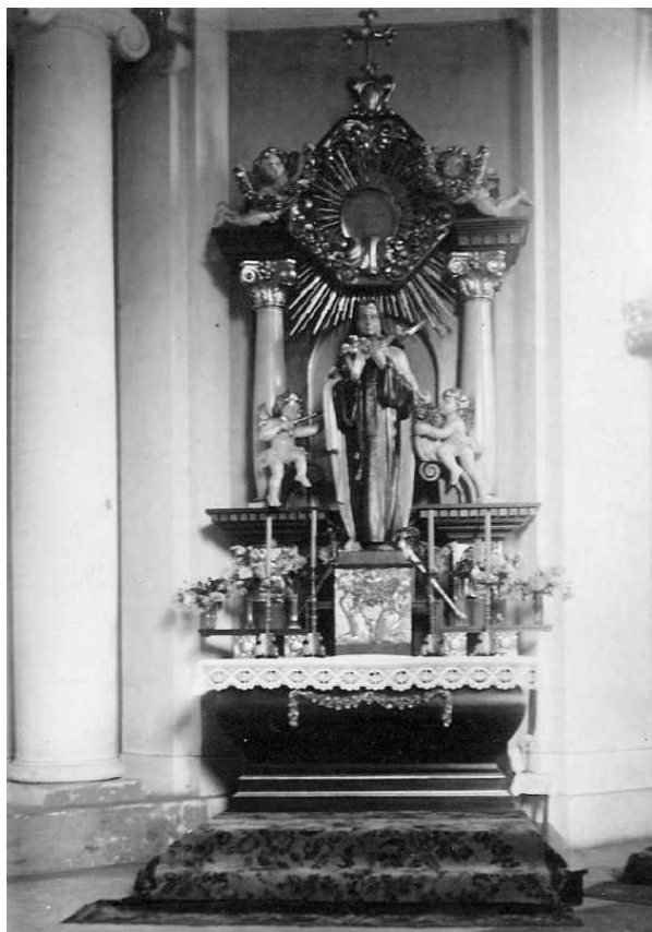
Jeden z bocznych ołtarzy z figurą św. Teresy – po prawej stronie, przeniesiony za radą biskupa ordynariusza z prezbiterium – w 1949 r. Figura obecnie znajduje się z prawej strony wejścia do kaplicy.

Z innych istotniejszych wiadomości tego roku: zapisano w księgach parafialnych ogółem 5.398 parafian, 156 ochrzczonych, 78 związków małżeńskich i 84 pogrzeby.