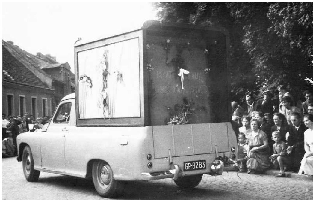
Pożegnanie Obrazu na ulicach miasta.