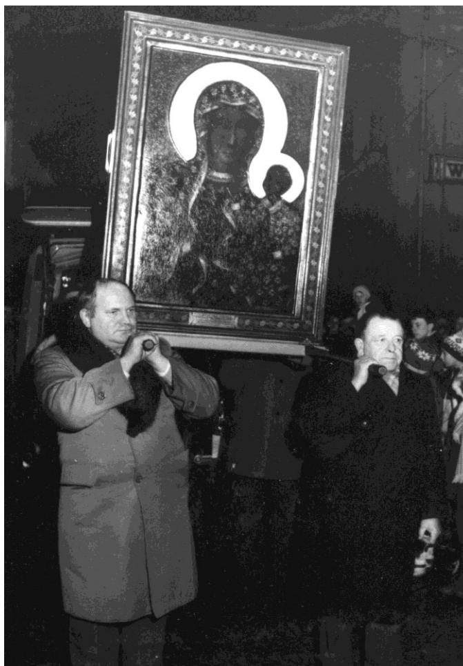
Obraz niosą Ojcowie z Rady Parafialnej.