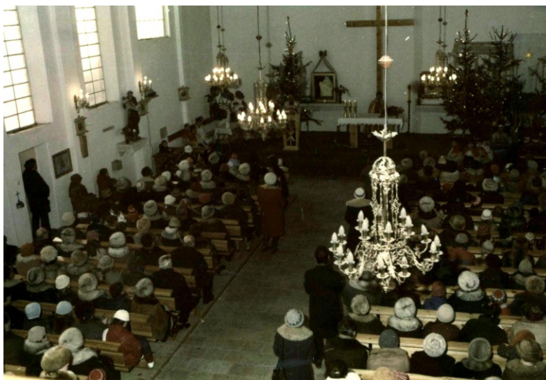
Poświęcenie kaplicy parafii MB Królowej Męczenników.