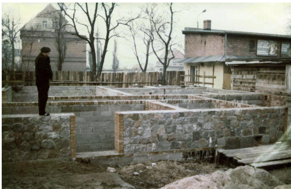
Ks. Proboszcz na budowie domu katechetycznego.

4 sierpnia parafia otrzymała pozwolenie na budowę domu katechetycznego przy plebani. Projekt wykonał mgr inż. Architekt Tadeusz Czerniawski z Bydgoszczy.