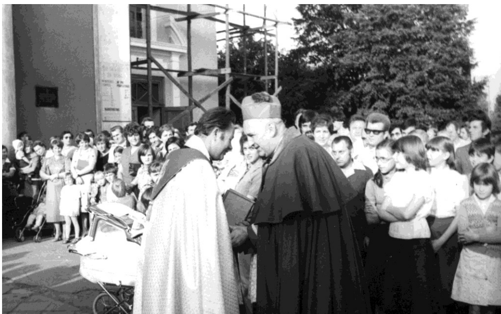
Powitanie Księdza Biskupa