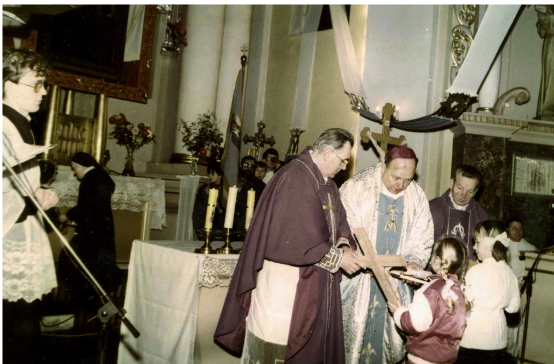
Dzieci składają w darze krzyż do salki katechetycznej.

Pielgrzymki: 23 kwietnia – diecezjalna do Gniezna – nowenna przed 1000-leciem śmierci św. Wojciecha, 8 maja – coroczna pielgrzymka młodzieży “Emaus” na Jasną Górę, 1 lipca – piesza, młodzieżowa do Chełmna, 3-13 sierpnia – X Jubileuszowa Piesza Pomorska Pielgrzymka na Jasną Gó-