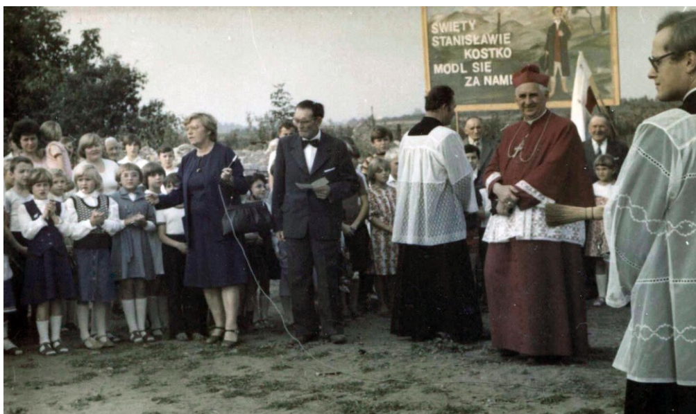
19 września, poświęcenie placu pod budowę domu katechetycznego.

18-19 września – odbyła się wizytacja kanoniczna biskupa Mariana Przykuckiego.