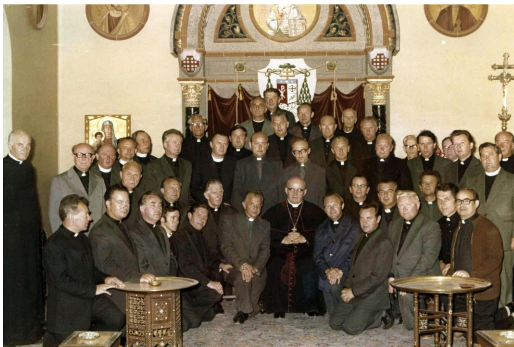
Uczestnicy pielgrzymki do Ziemi Świętej.

21 i 22 października – ks. Proboszcz dzielił się wspomnieniami oraz wyświetlał przeżycia z Pielgrzymki do Ziemi Świętej.