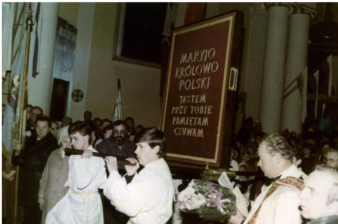
Obraz niosą ministranci.