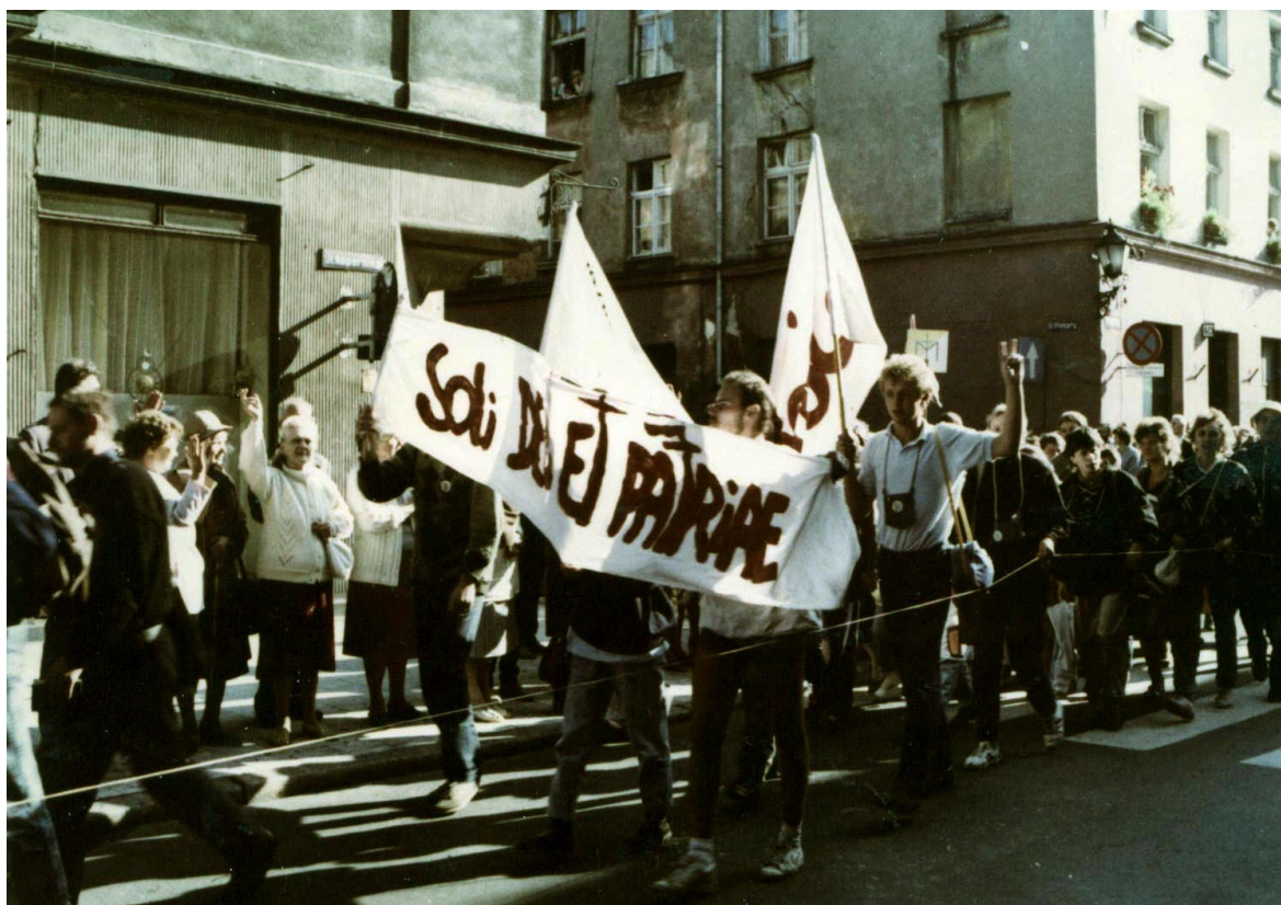
Grupa bialo-żółta po raz dziesiąty w drodze na Jasną Górę.

rę; pożegnanie grupy fordońskiej, 17-18 września – autokarowa pielgrzymka Świata Pracy na Jasną Górę, 25 września – pielgrzymka Świata Pracy do bazyliki katedralnej w Pelplinie, 14-15 października – parafialna na Jasną Górę, 12 listopada – do Lichenia