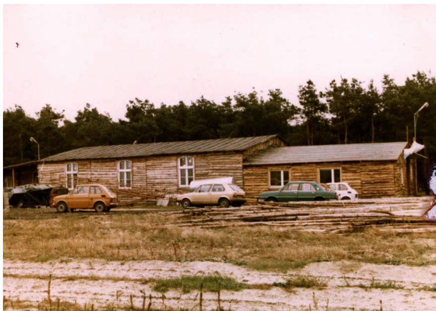
Drewniana kaplica (betlejemka) pw. św. Mateusza.